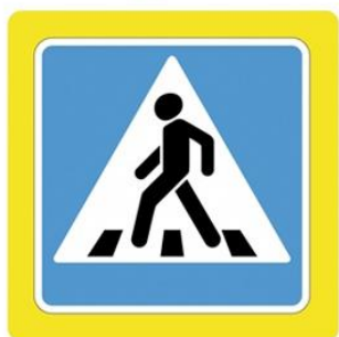
Наземный пешеходный переход