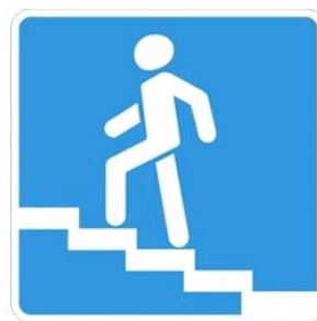
Надземный пешеходный переход